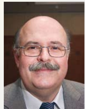
Prof. Dr. med. Helmuth G. Dörr

nischen Beschreibung des SGA-Neugeborenen sollte daher auch vermerkt werden, welcher der beiden Parameter unter der Norm liegt (z.B. SGA-Neugeborenes: Länge) oder ob sogar beide unter - 2 SD liegen (z.B. SGA-Neugeborenes: Länge + Gewicht). Wird die Mangelsituation bereits intrauterin, das heißt innerhalb der Schwangerschaft, z.B. mittels Ultraschall festgestellt, dann wird auch die Bezeichnung intrauterine Wachstumsrestriktion (intrauterine growth restriction, IUGR) verwendet. IUGR definiert somit die pathologische Situation einer intrauterinen Wachstumshemmung besser, während SGA im Grunde genommen eine beschreibende Bezeichnung ist.