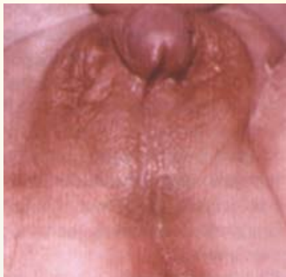
Abb. 3: Vermännlichtes äußeres Genitale eines Mädchens mit AGS (21-Hydroxylase-Defekt)