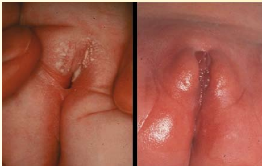
Abb. 4: Normales äußeres Genitale von zwei Mädchen mit AGS-21-Hydroxylase-Defekt nach pränataler Therapie mit 3 x 0,5 mg Dexamethason

ein Fetus pro Jahr bis zur Geburt behandelt. Da kann man nicht von einer Routinetherapie sprechen. Obwohl eine zentrale Datenerfassung seit 1990 eingeführt ist, werden die Daten nicht gemeldet. So wurden 1999 nur 2 neue Fälle in der Datenbank erfasst, im Jahr 2000 wurde überhaupt kein einziger Fall einer pränatalen AGS-Therapie dokumentiert. Alle Berichte erfolgen auf freiwilliger Basis, es gibt für den behandeln-